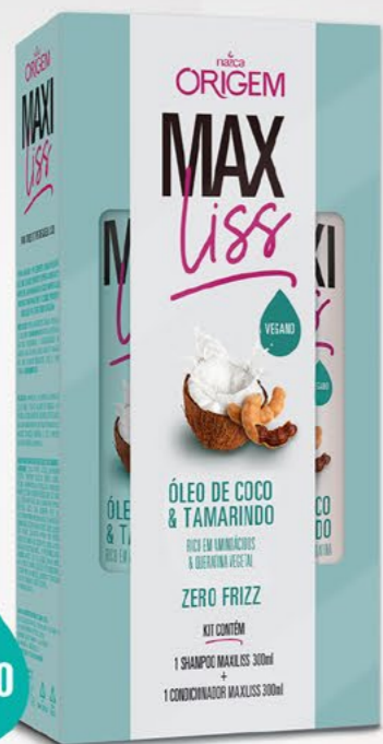
ORIGEM KIT MAXILISS 300ML: 0101.0854