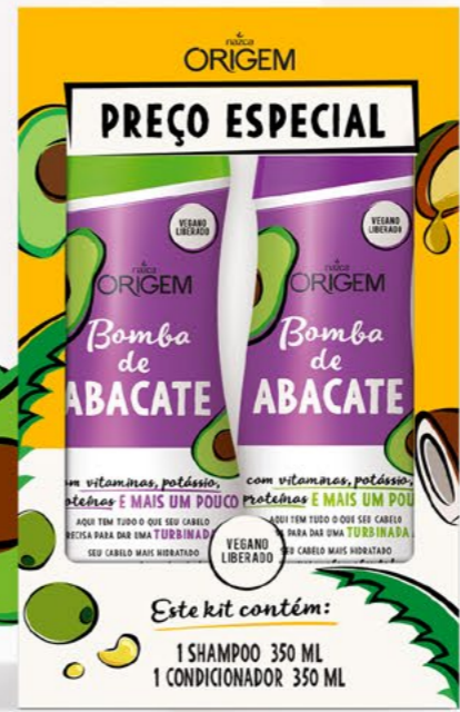
ORIGEM KIT BOMBA DE ABACATE 350ML: 0101.0982