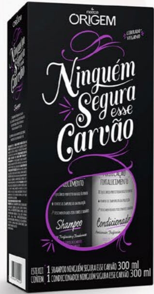
ORIGEM KIT NINGUÉM SEGURA ESSE CARVÃO 300ML: 0101.0816