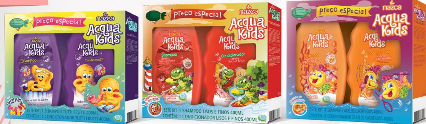
ACQUA KIDS KIT TUTTI FRUTTI 400ML: 0107.0558