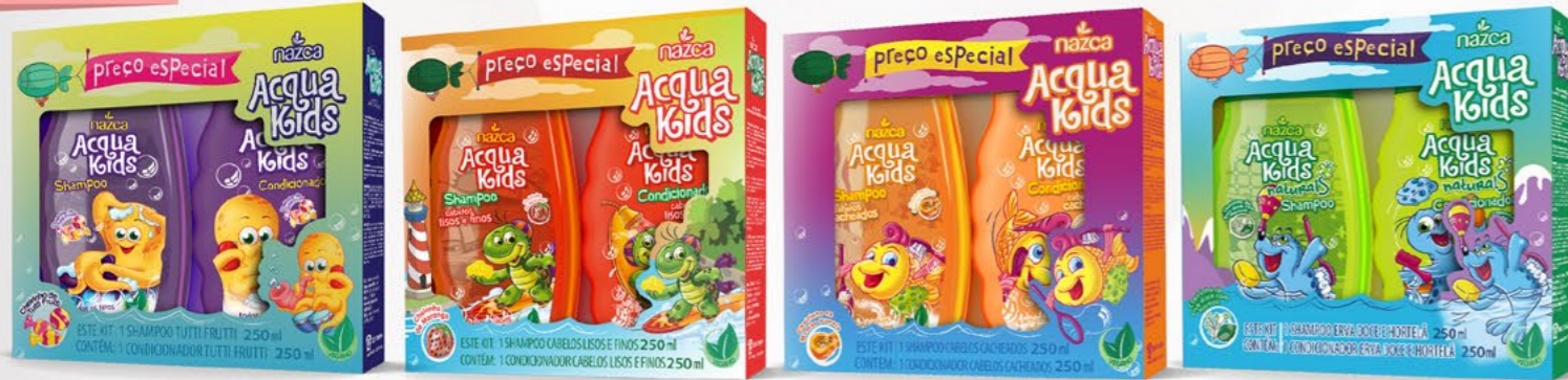
ACQUA KIDS KIT TUTTI FRUTTI 250ML: 0107.0599