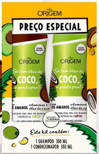
ORIGEM KIT ÓLEO DE COCO 350ML: 0101.0979