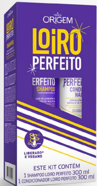
ORIGEM KIT LOIRO PERFEITO 300ML: 0101.0815