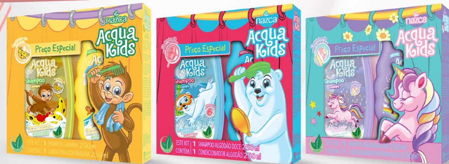
ACQUA KIDS KIT BANANA 250ML: 0107.0569