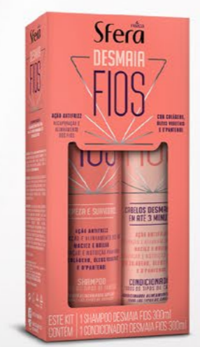
SFERA KIT DESMAIA FIOS 300ML: 0106.0903