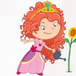
GRUPEY KIDS ADEUS FRIZZ 500ML: 0101.0879