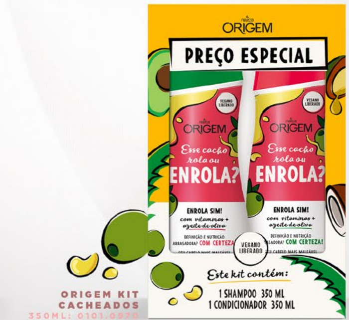
ORIGEM KIT CACHEADOS 350ML: 0101.0978