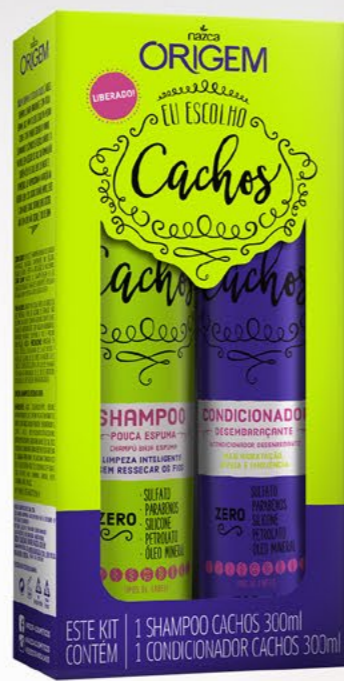
ORIGEM KIT EU ESCOLHO CACHOS 300ML: 0101.0707