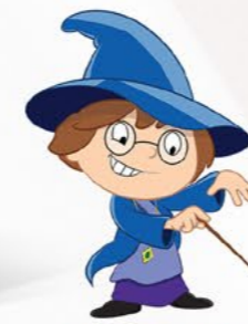
GRUPEY KIDS FORÇA VITAMINADA 500ML: 0101.0881