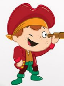
GRUPEY KIDS XÔ EMBARAÇO 500ML: 0101.0877