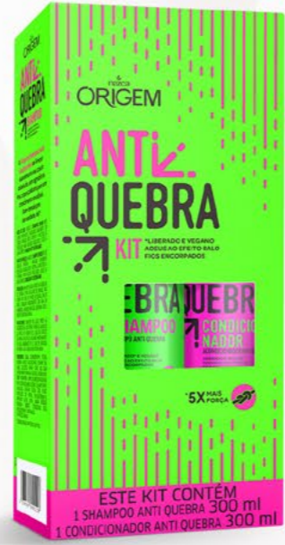
ORIGEM KIT ANTI QUEBRA 300ML: 0101.0813