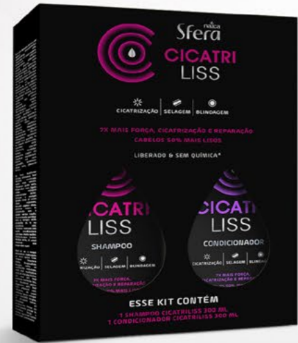
SFERA KIT CICATRI LISS 300ML: 0106.0933