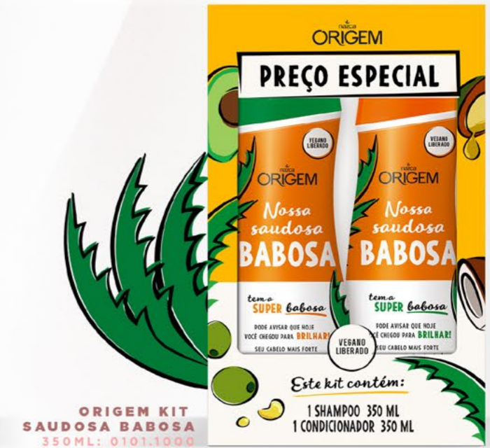
ORIGEM KIT SAUDOSA BABOSA 350ML: 0101.1000