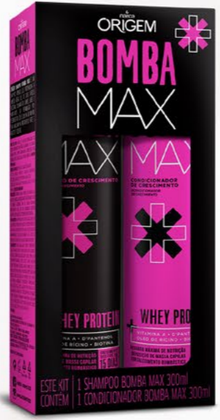
ORIGEM KIT BOMBA MAX 300ML: 0101.0766