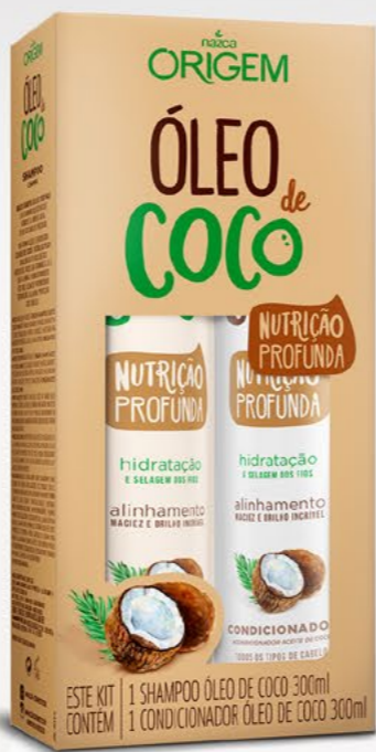
ORIGEM KIT ÓLEO DE COCO 300ML: 0101.0741