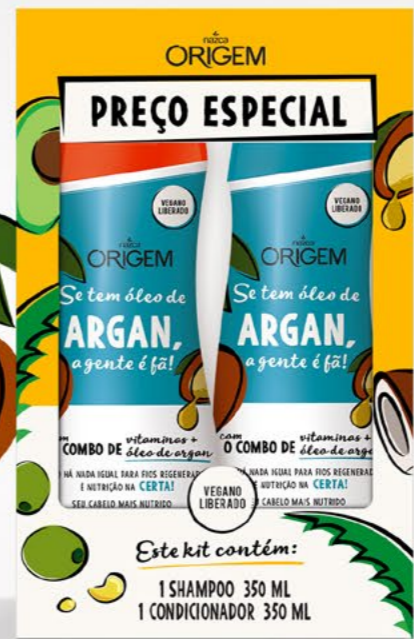
ORIGEM KIT ÓLEO DE ARGAN 350ML: 0101.0984