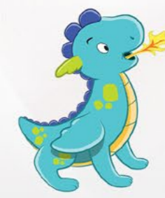
GRUPEY KIDS HIDRATA DE MONTÃO 500ML: 0101.0878