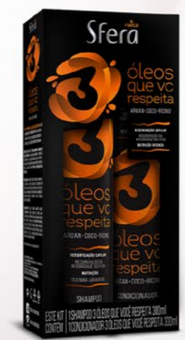
SFERA KIT 3 ÓLEOS QUE VC RESPEITA 300ML: 0106.0897