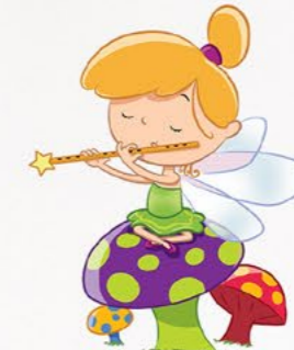
GRUPEY KIDS BRILHO ILUMINADO 500ML: 0101.0880