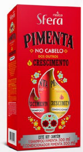
SFERA KIT PIMENTA 300ML: 0106.0926