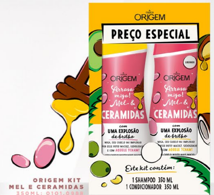
ORIGEM KIT MEL E CERAMIDAS 350ML: 0101.0988