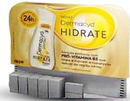
Display de chão