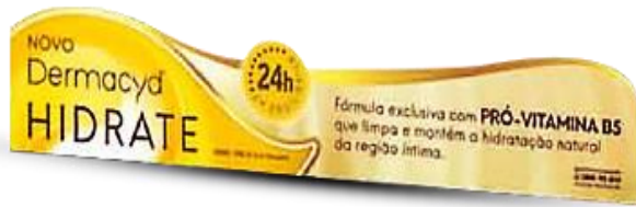
Faixa de Gôndola